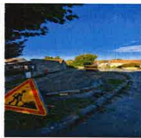
Un emplacement pour les vélos est déjà en place.

ATTENTION : Il ne sera plus possible de se garer sous les tilleuls de la rue.